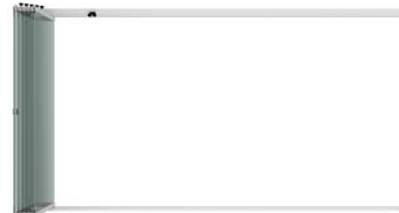
Großer Öffnungsbereich bei geöffneten Elementen Large opening space when elements are opened