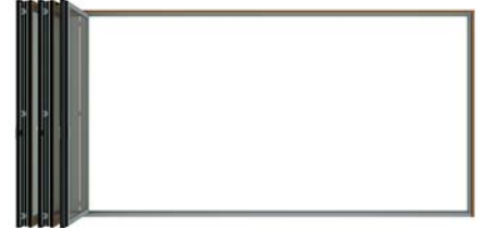
Parken der Faltflügel Parking of the folded panels