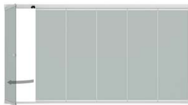
Einfaches Öffnen mit Zugstange Simple opening by operating a pull rod